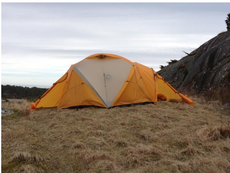
Akkurat plass til vårt telt!