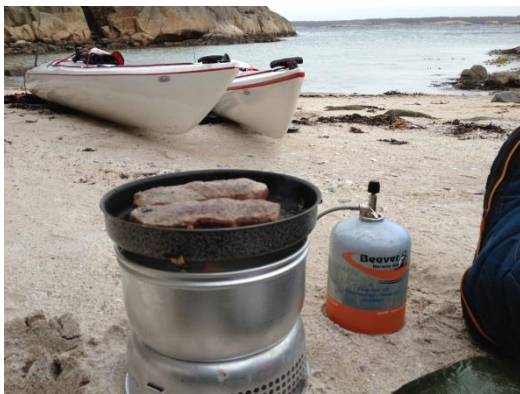
God mat er viktig!

Vi fikk kajakkene på vannet før kl 11 og var fornøyd med det. Det begynte å blåse opp, så vi bestemte oss for å padle indre vei til Strømstad, og med kraftig vind i ryggen gikk dette unna. Det var ikke mye liv i Strømstad havn på denne tiden av året, så vi satte kuren vestover mot Styrösö som vi hadde fått anbefalt som overnattingsplass. Nå fikk vi kjenne på vinden som var økende. Og tross den korte avstanden (6 km) ut til Styrösö ble det en hard distanse. Teltplassen var topp og helt i le for vinden fra sørvest som fortsatt økte på.