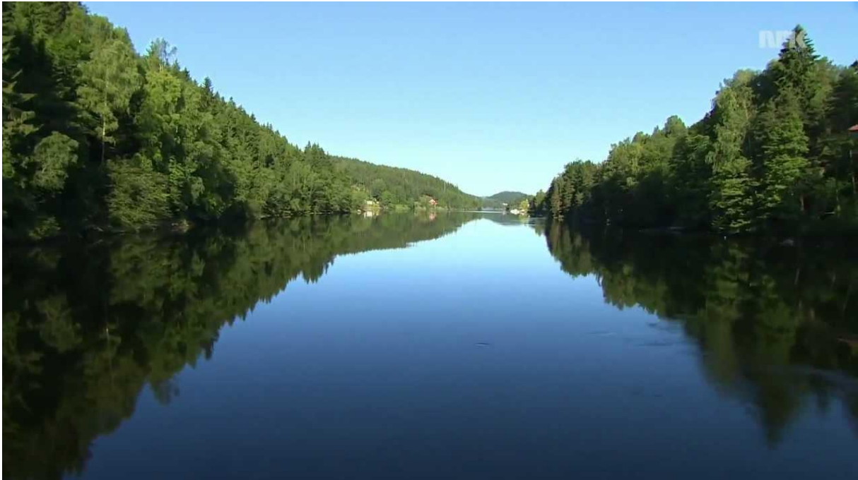
Padleparadis og kanal idyll.

Dag 3 så skinte solen fra skyfri himmel, det eneste som ødela idyllen noe var en del trafikkstøy fra riksveien som går langs Nomevannet.