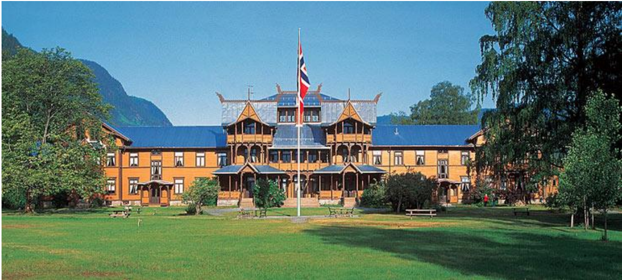
Eventyrhotellet Dalen Hotell innerst i Badak.

Himmelen er helt blå, solen skinner og vi er i ferd med å riste av oss sjokket etter å ha sjekket ut av Dalen Hotell i Telemark (ingen av oss visste at middagen kvelden før hadde blitt så kostbar). En velvillig butikksjef på Coop i Dalen hadde åpnet butikken en halv time før vanlig åpningstid slik at vi kunne få «bunkret» nødvendig mat og drikke til turen.